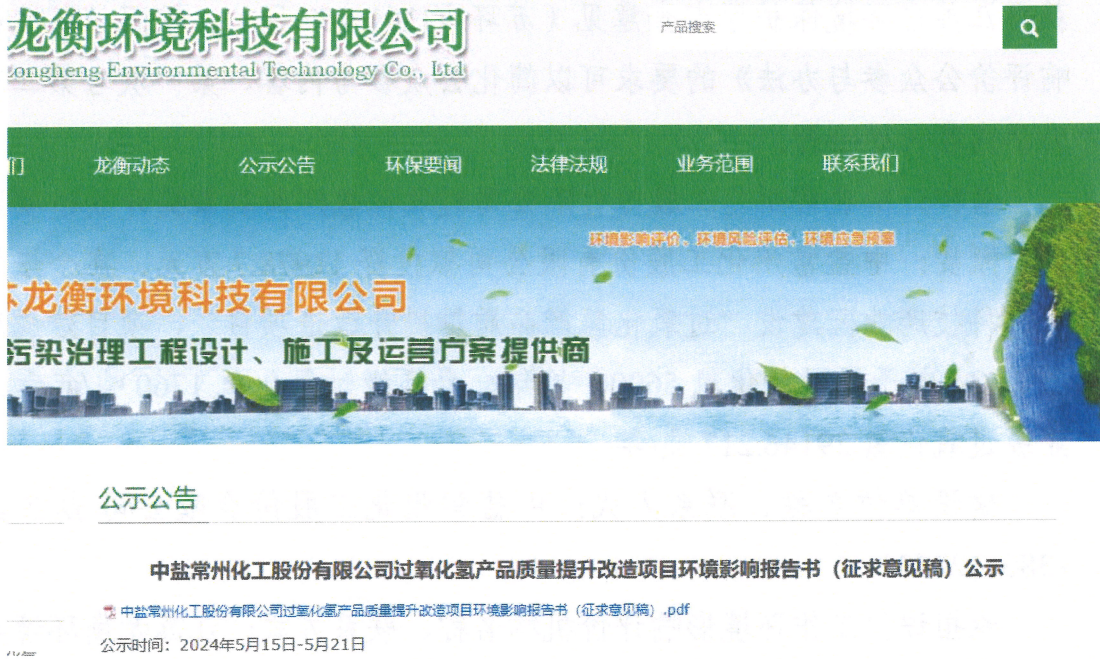
图1 环境影响报告书网络公示

根据国家环保总局《环境影响评价公众参与办法》（部令第4号）的要求，2024年5月15日-2024年5月21日在江苏龙衡环境科技有限公司 http://www.jslhhkj.com/content/?330.html 进行了环境影响评价网络公示。