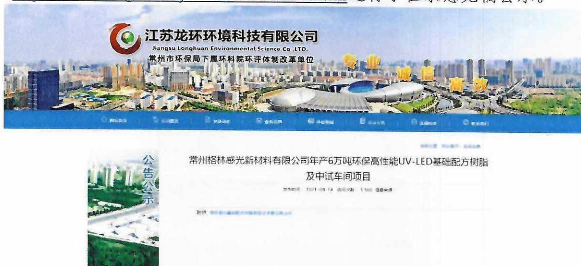
图 1 环境影响报告书征求意见稿公示

根据国家环保总局《环境影响评价公众参与办法》（部令第4号）的要求，2021年9月14日在江苏龙环环境科技有限公司网站 http://www.longhuanhj.com/news/3094.html 进行了征求意见稿公示。